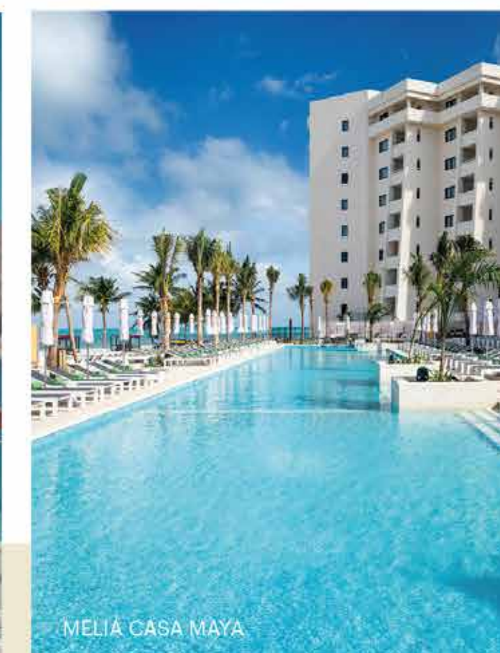
MELIÁ CASA MAYA