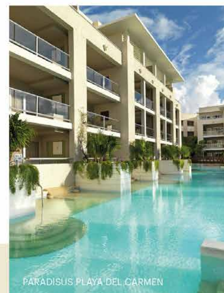
PARADISUS PLAYA DEL CARMEN