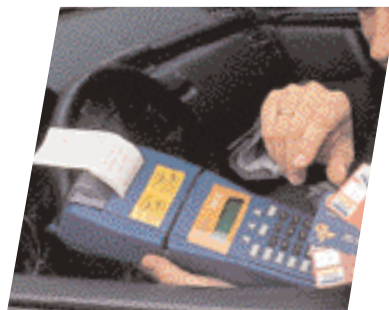
Telefónica Data España ha colaborado con First Data Ibérica en la puesta en marcha del sistema de pago en los taxis