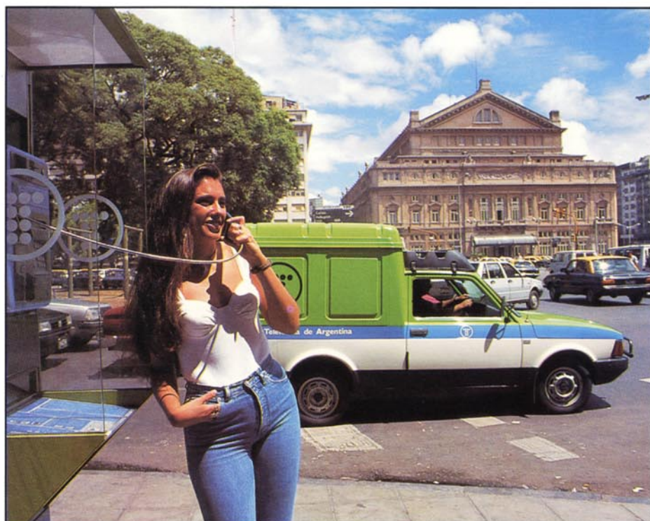
Una de las cabinas públicas situadas en el centro urbano de Buenos Aires.

En cuanto a la apertura de nuevos mercados, se ha continuado manteniendo un interés preferente por el sector hispanoamericano. En el mes de febrero de 1994 Telefónica Internacional resultó ganadora en el proceso de privatización de las operadoras peruanas CPT y Entel-Perú, adquiriendo con ello presencia en uno de los mercados con mayor potencial de crecimiento en la región. Desde esta fecha se ha producido un notable incremento en el programa de instalaciones, lo que permitió alcanzar la cifra de 180.168 líneas instaladas a final de ejercicio, un 45% superior al compromiso asumido en el contrato de concesión. También se ha entrado en el mercado colombiano, al resultar el consorcio Cocolco, adjudicatario de una licencia para operar telefonía móvil celular en la región de mayor crecimiento de Colombia, que incluye la zona de los cafetales y las ciudades de Cali y Medellín. En los meses transcurridos, Cocolco ha alcanzado cerca de 20.000 clientes con una cuota de mercado del 65% .