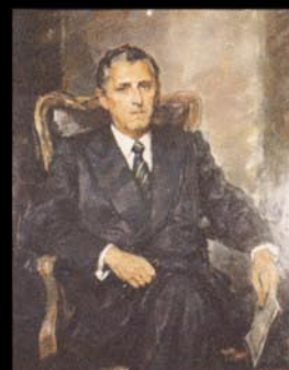
D. Antonio Barrera de Irímo 1965 - 1973