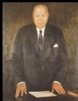
D. José Navarro Reverter y Gomis 1945 - 1965