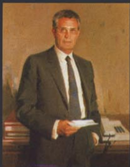
D. Salvador Sánchez-Terán 1980 - 1982