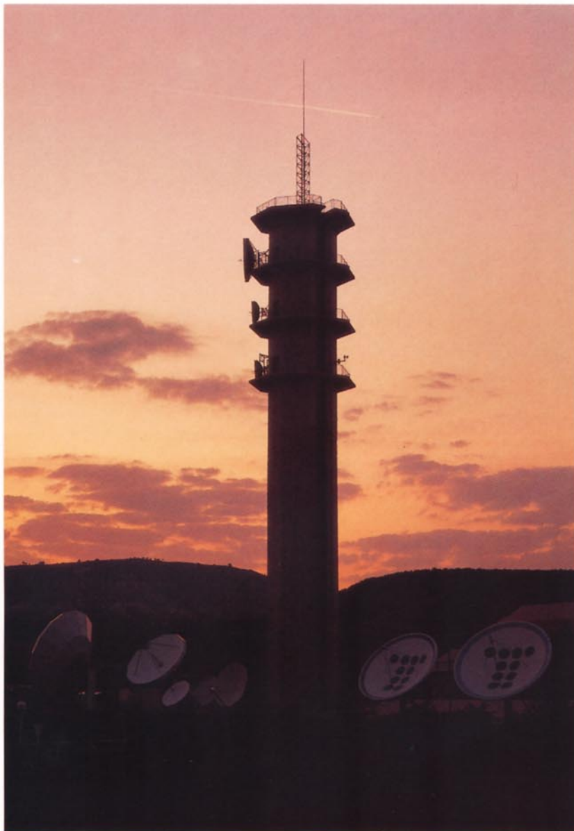
Torre de antenas de la Estación terrena de Armuña de Tajuña.