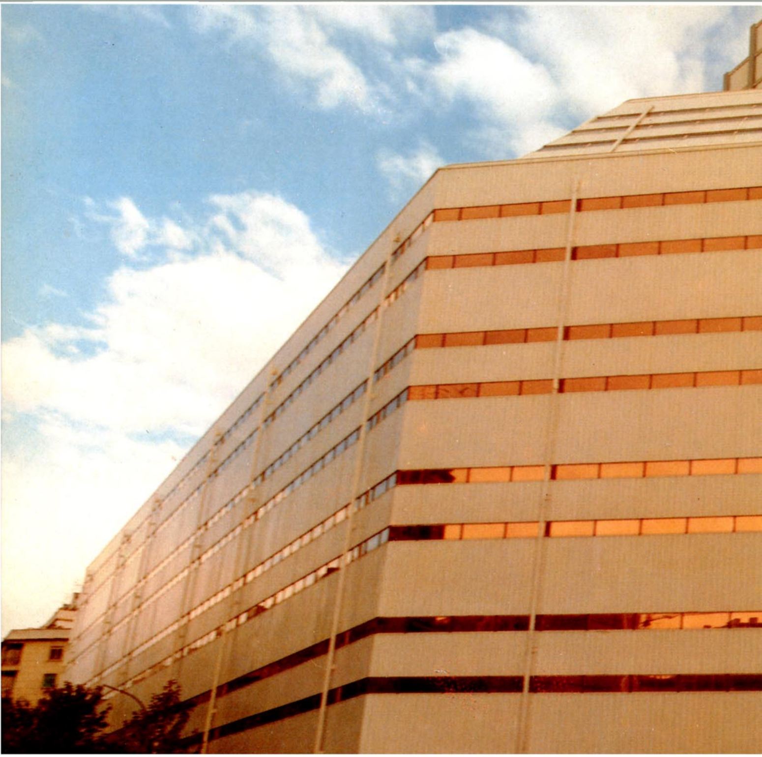
Central Estel, Barcelona.