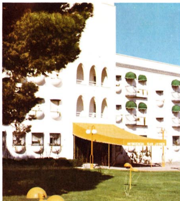
Residencia de jubilados de la Institución Telefónica de Previsión. San Javier, Murcia.

necesarios para el desenvolvimiento de su actividad, la Compañía ha considerado necesaria su participación en el Capital de determinadas Empresas.