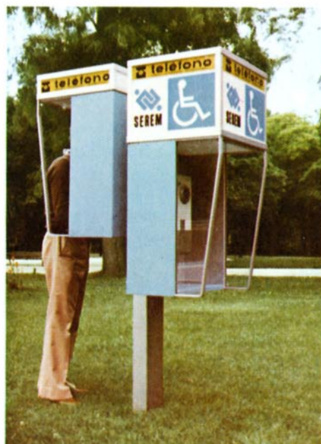
Cabina telefónica para minusválidos.