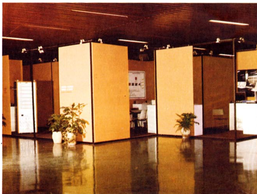
Stand de la Compañía en la Conferencia Internacional de Informática. Torremolinos.