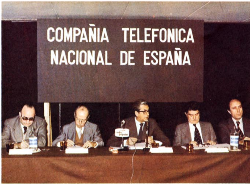
Conferencia de prensa diciembre 1978.