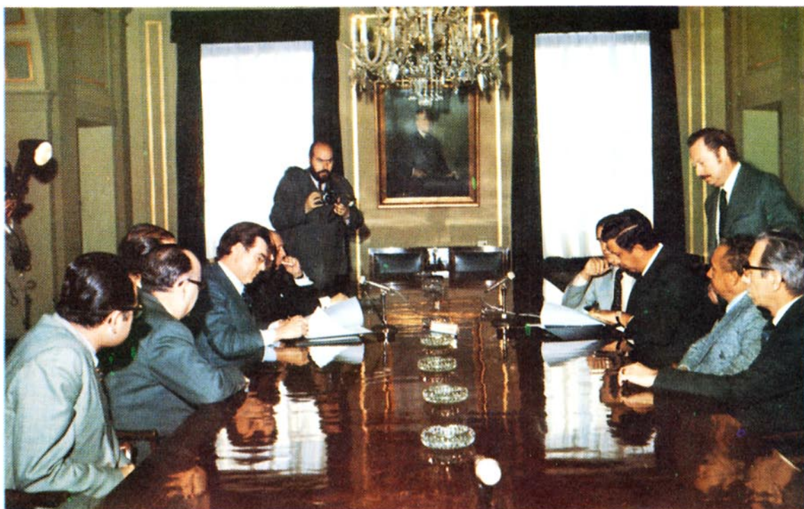
Firma del acuerdo para la instalación del cable submarino Columbus entre España y Venezuela.

En el mes de octubre de 1975 se celebró en Ginebra (Suiza) la Exposición Mundial de Telecomunicaciones, TELECOM-75, la más importante en su género de las celebradas hasta la fecha. Concurrieron a la muestra 320 Empresas de 37 países y los 144 países miembros de la Unión Internacional de Telecomunicaciones estuvieron presentes en ella. España estaba representada por la Compañía Telefónica, en cuyo «stand» se mostró una amplia descripción del desarrollo telefónico en nuestro país.