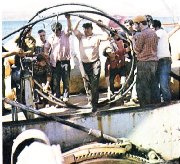
Cable submarino Palma-Argel (operaciones a bordo del buque cableero).

Actividades a destacar, especialmente dentro del desarrollo informático en la Compañía, han sido las ampliaciones en el Servicio Automático de Reclamaciones de Averías (Madrid y Barcelona) y en el Servicio Mecanizado de Información del 003 (Madrid, Barcelona, Valencia, Sevilla y San Sebastián); la mecanización del Plan Individual de Inversiones, y la extensión del uso remoto de los recursos informáticos de que dispone la Compañía a partir de terminales ubicados en las principales áreas generadoras de información o usuarias de la Informática.