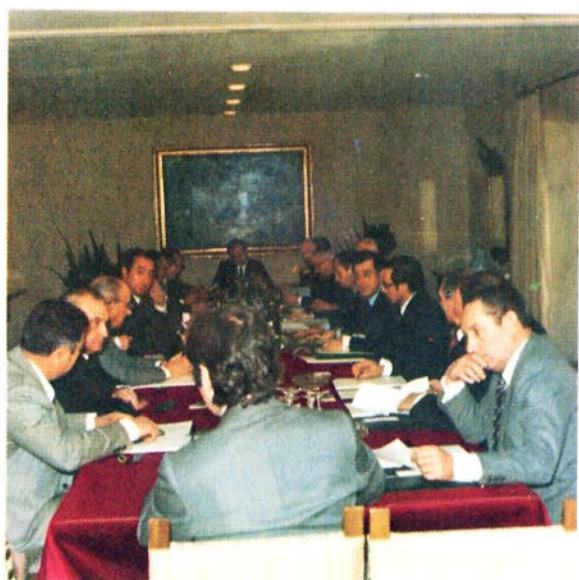
Consejo Asesor Regional del Noroeste.