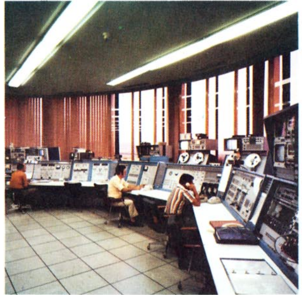
Estación de Buitrago. Consola de mandos. Sala de control.

Los Productos de Explotación han alcanzado en el Ejercicio la cifra de 47.471 millones de pesetas, suponiendo un incremento de 9.656 millones (25,5 por 100) sobre el año anterior.