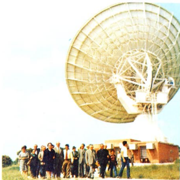
Visita de Accionistas de la Compañía a la Estación de Buitrago.

La tensión de liquidez mantenida durante todo el Ejercicio, así como lo elevado del coste del dinero, no ha encaminado volúmenes de ahorro hacia la inversión en valores en cifras suficientes como para recuperar una tónica alcista.