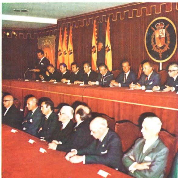
Exposición 50 Aniversario en Madrid.