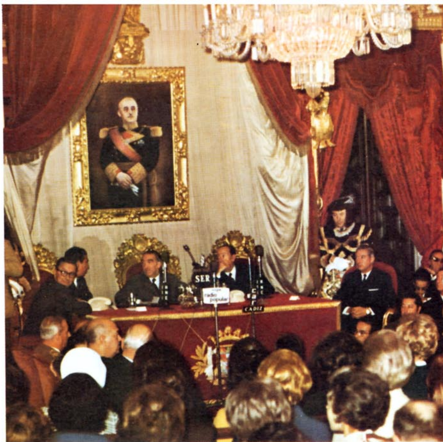
Acto inaugural del sistema TAT-5/MAT-1.

Las nuevas Redes Automáticas Provinciales inauguradas durante el año, fueron las de Sevilla, con integración de Alcalá de Guadaíra y Dos Hermanas; Toledo, con integración de Talavera y Cazalegas; Albacete, con Hellín, y Granada, con Motril. Con ello, son 33 las provincias que cuentan con este servicio. En las Redes Automáticas Provinciales existentes con anterioridad se integran los 56 centros siguientes: