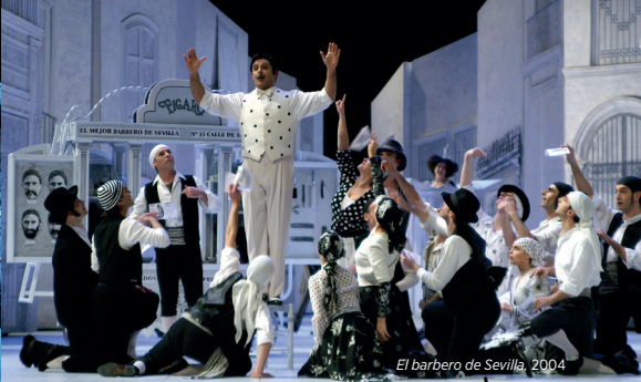
El barbero de Sevilla, 2004