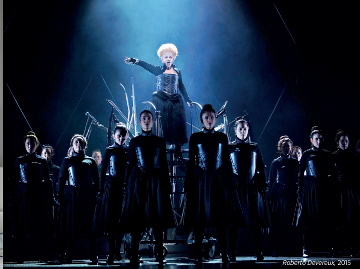
Roberto Devereux, 2015