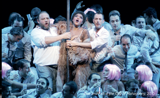
Rise and Fall of the City of Mahagonny, 2010