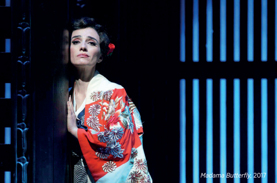
Madama Butterfly, 2017