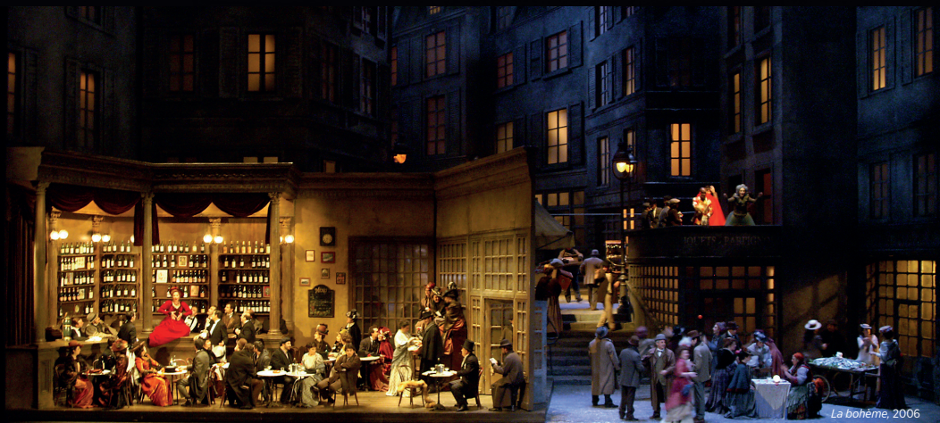
La bohème, 2006