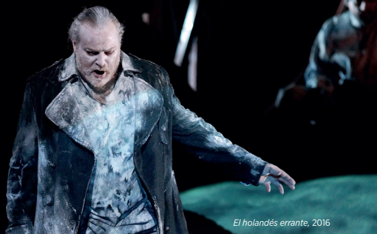
El holandés errante, 2016