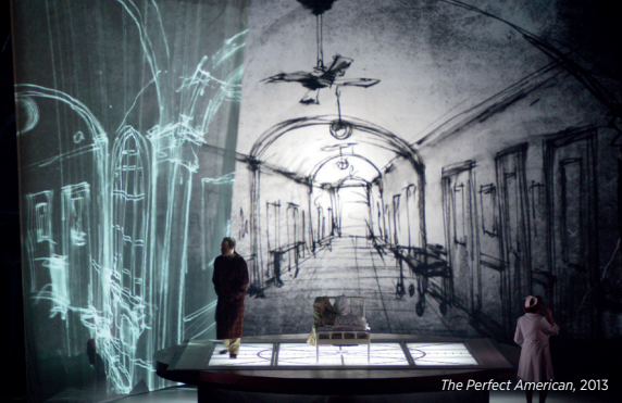
The Perfect American, 2013