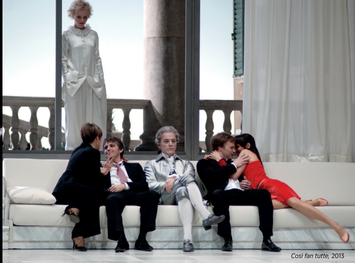
Cosi fan tutte, 2013