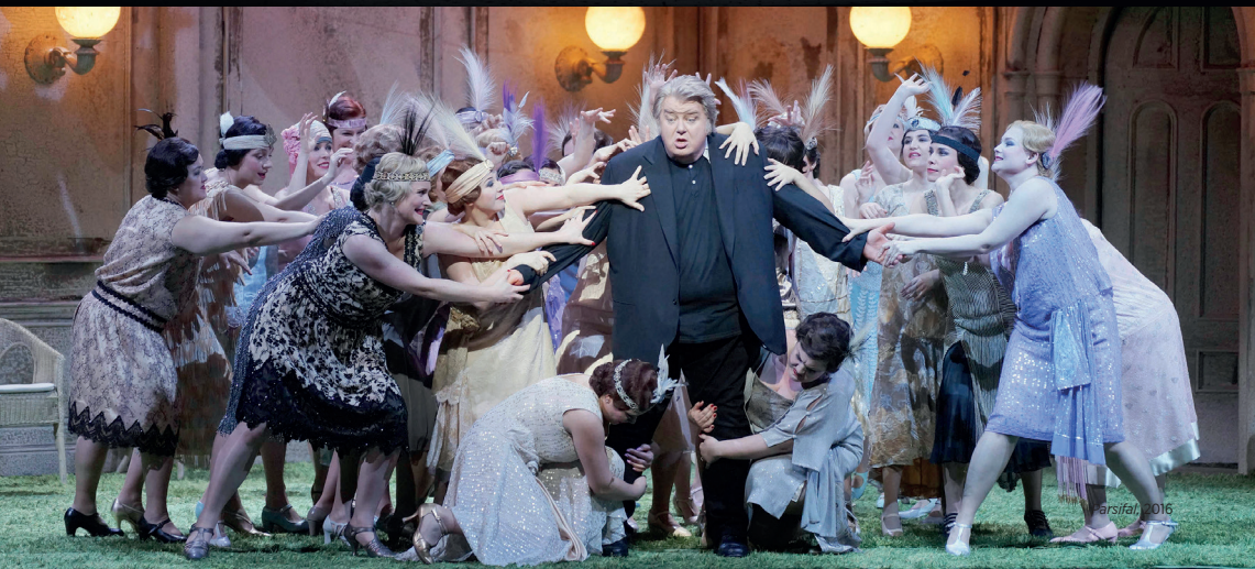
Madama Butterfly, 2016

La traviata —retransmisión en directo desde el Teatro Real