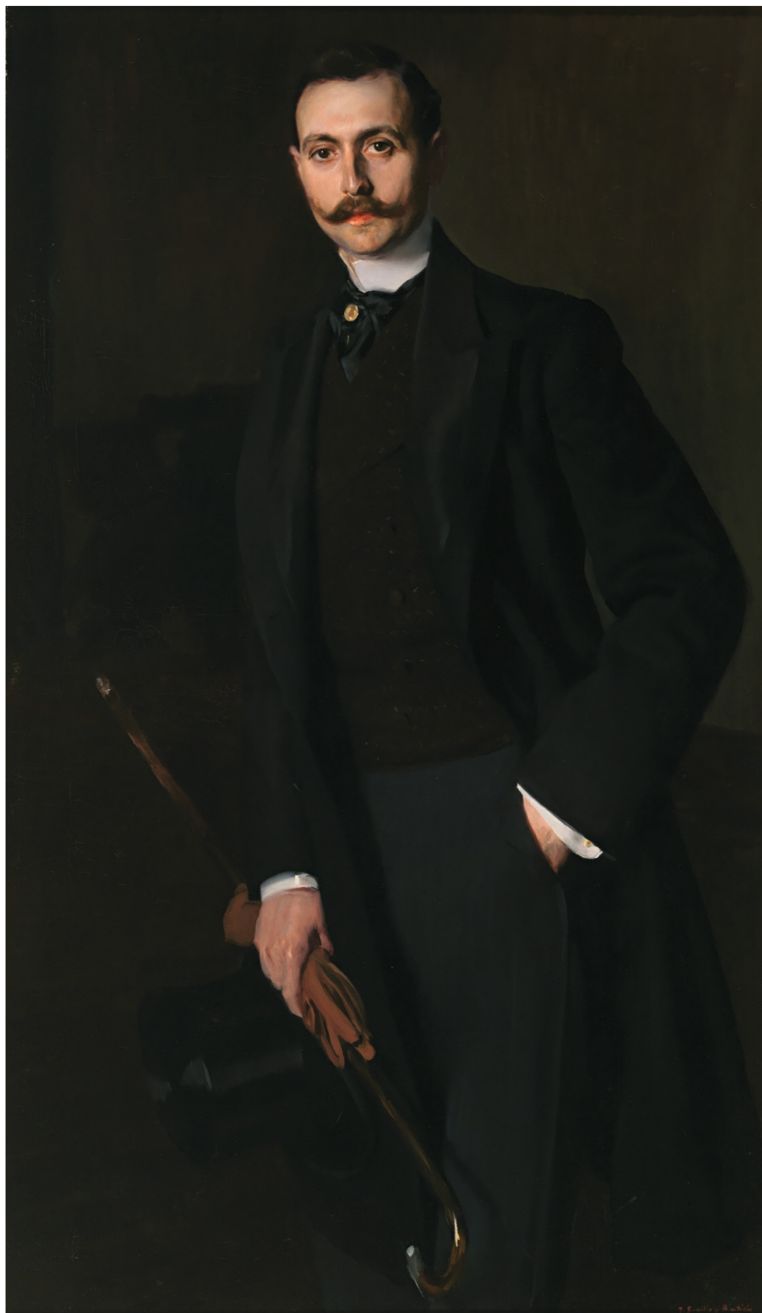
JOAQUÍN SOROLLA, AURELIANO DE BERUETE Y MORET, HIJO, 1902, MUSEO NACIONAL DEL PRADO.

http://www.amigosmuseoprado.org/colectivos/accionistastelefonica