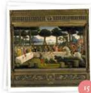
Amores profanos (Radio 3)