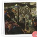
Grandes superproducciones (Radio 3)