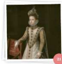
Un cuento de hadas (Radio 3)