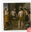
Tiempo de fabulas. Los mitos y los dioses (Radio 3)