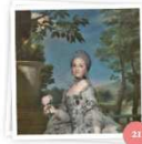
Fashion night (Radio 3)