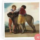
El reino animal (Radio 3)