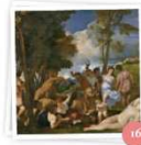
Fiestas y banquetes que no debes perder (Radio 3)