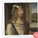
Zona VIP (Radio 3)