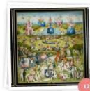
Los sueños de la razón (Radio 3)