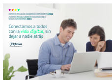
Informe de Gobierno Corporativo e Informe sobre Remuneraciones