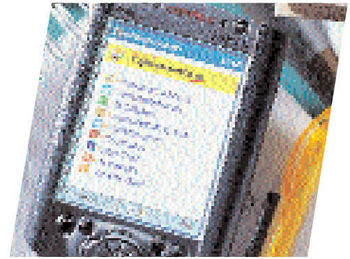
Páginas Amarillas continúa siendo la principal fuente de ingresos del grupo TPI, aportando un 68,2% del total de los mismos

A lo largo del año, se editaron 79 libros de páginas blancas, con una tirada de más de 21 millones de ejemplares. Los ingresos publicitarios del producto crecieron un 21,2%, alcanzando los 64,95 millones de euros.