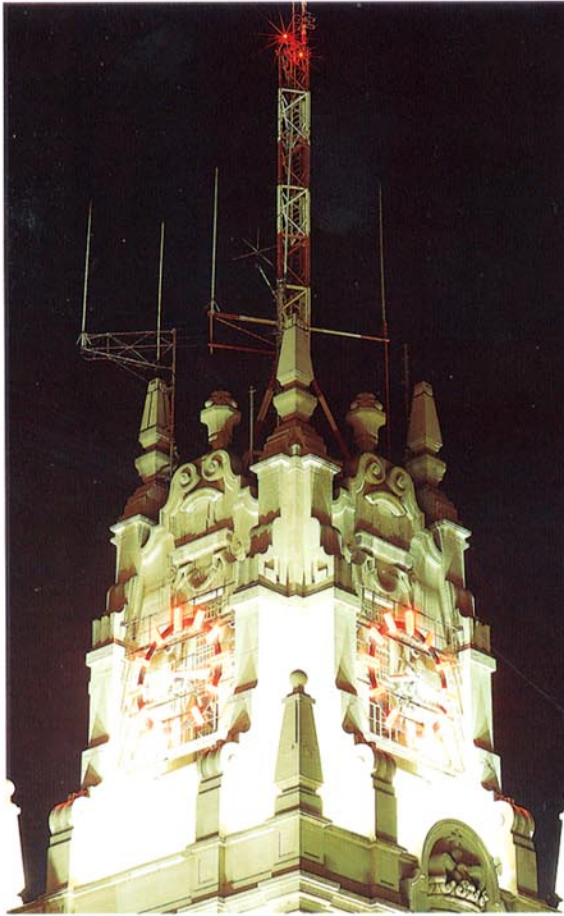
Torre de la Sede Central de Telefónica, en Madrid

Por otra parte, en septiembre de 1992 se redujo la participación en la empresa Ecotel, sociedad dedicada a la realización de estudios de audiencia televisiva, al enajenarse un 60% de dicha participación al grupo francés Sofres, quedando Telefónica con un 40% del capital social de la compañía.