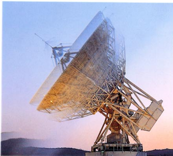
Las empresas del Grupo Telefónica utilizan una infraestructura en permanente renovación. Antena del Centro de Comunicaciones por Satélite de Arnuña de Tajuña

No obstante, las empresas filiales de Telefónica continúan en su proceso de mejora de la gestión y de ordenación de los distintos negocios que desarrollan en el entorno competitivo en que operan, aspectos en que se han centrado los esfuerzos del Grupo. En este sentido, cabe destacar la creación de la Compañía Gestora del Servicio Mensatel (CGS Mensatel), que fue adjudicataria de una de las tres licencias concedidas por la Administración para la explotación del Servicio de Radiobúsqueda y que competirá en este mercado en el marco del proceso de liberalización del sector de las telecomunicaciones.